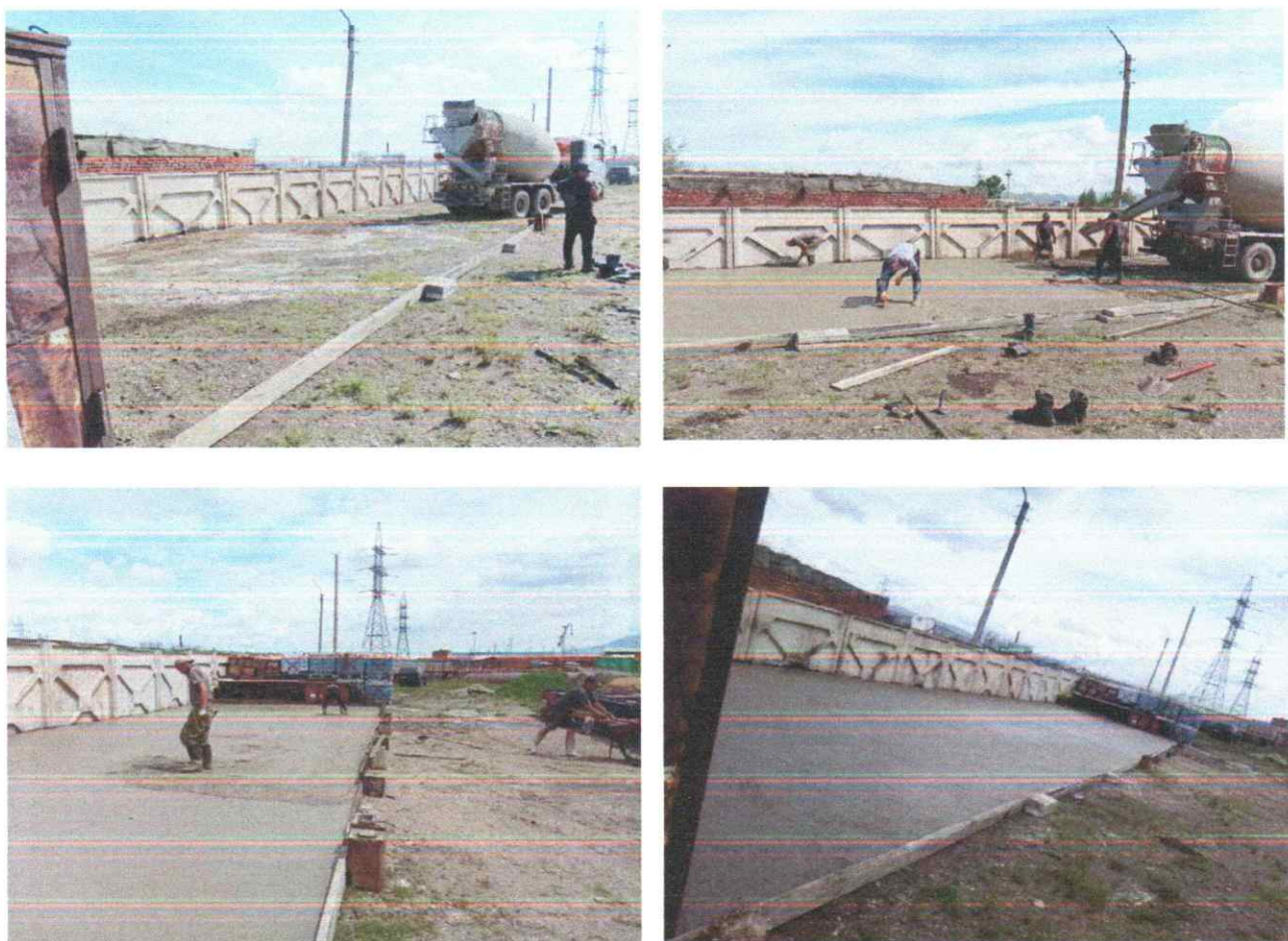
Зураг 7. Бетондсон хэсэг

7. Хаягдал тос буулгах цэгийн хөрсийн хамгаалах үүднээс бохирдсон хөрсийг бетондож, хөрсний бохирдсон хэсгийн хорыг саармагжуулах ажил хийгдсэн.