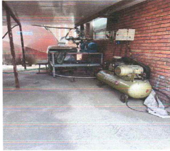
Зураг 8. Хөргөлтийн төхөөрөмж

9. Үйлдвэрийн хашаан дотор хөрс хамгаалах, цөлжилтөөс сэргийлэх тухай хуулийн дагуу улиас, хайлаас, гацуур мод тарьж, зүлэгжүүлэх, ногоон байгууламжтай болгож байна.