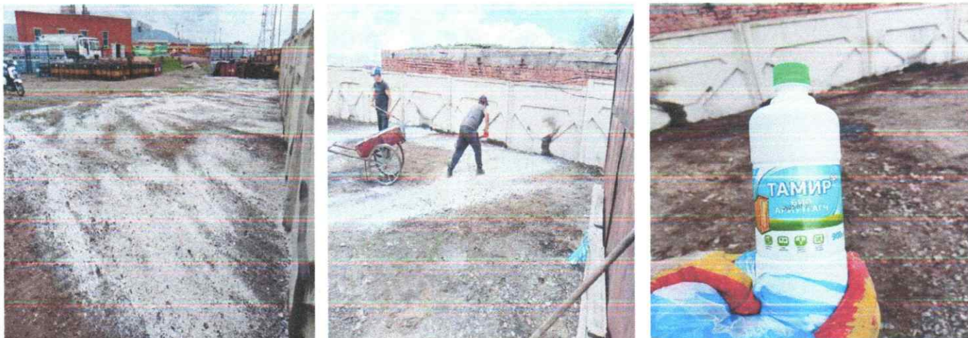
Зураг 6. Хөрс хусаж цэвэрлэх

6. Хаягдал тос буулгах цэгийн хөрсийн хамгаалах үүднээс бохирдсон хөрсийг хусаж цэвэрлэх, хөрсөө саармагжуулалт хийх, ажил эхлүүлсэн болно.