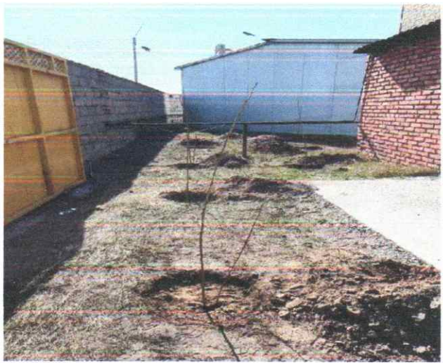
Зураг 9. Мод тарилт