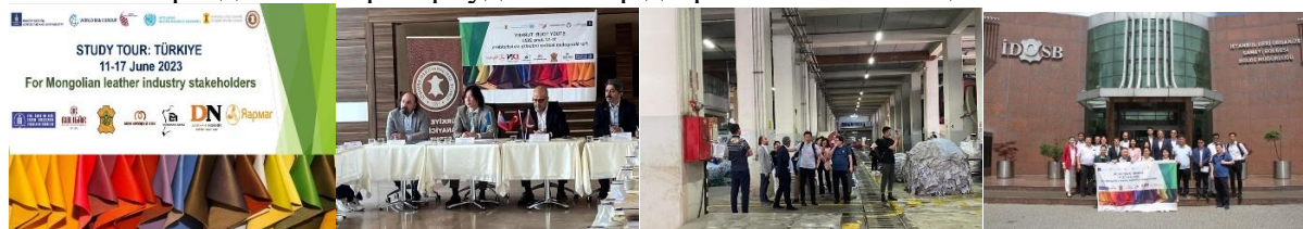
LINEAPELLE 2023 /намар/

Тус аялалд арьс шир боловсруулах 6 үйлдвэр аж ахуйн нэгжийн удирдлагууд, технологичид, лаборатори, МАНУХолбоо, ХХААХҮЯ-ны холбогдох төлөөлөл бүхий нийт 16 хүн оролцов. Булигаар ХК-ийн зүгээс 3 ажилтан оролцсон. Туршлага судлах ажлын үр дүнд Турк улсын Тузла болон Бурса дахь LWG-ийн алтан медаль бүхий стандарт нэвтрүүлсэн арьс ширний үйлдвэрүүд, цэвэрлэх байгууламжууд, аж үйлдвэр технологийн паркууд болон олон улсад хүлээн зөвшөөрөгдсөн лабораториудтай газар дээр нь очиж танилцсан.